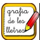
Grafia de les lletres